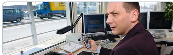
Industria e sicurezza