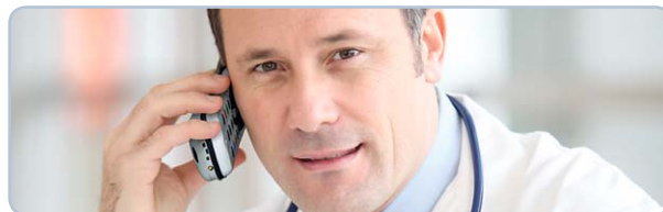
Studi medici, ospedali e cliniche psichiatriche