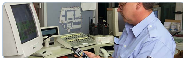
Sicurezza e strutture pubbliche