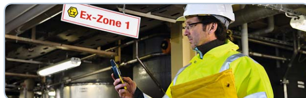
Zone industriali antideflagranti