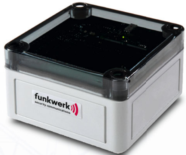
funkwerk D.A.N.-Detector zur ISM-Band-Lokalisierung

Die funkwerk D.A.N.-Detektoren lassen sich per Funkübertragung über das ISM-Frequenzband (869,6875 MHz) installations- und wartungsfreundlich über die Luftschnittstelle („over the air“) einrichten. Ein Öffnen des Gehäuses ist nicht notwendig. Bei der optimalen Verteilung der Geräte unterstützt Sie die D.A.N. Wireless Configuration Software mit Daten und Hinweisen.